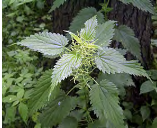
ORTIGA MAYOR ( Urtica dioica )

Aguardiente de nueces: Unas 20 nueces verdes se parten en 4 pedazos y se llena con ellos una botella de cuello ancho; se le echa un litro de aguardiente que tiene que sobrepasar las nueces en 2 ó 3 dedos. La botella se deja bien tapada de 2 a 4 semanas al sol o en un lugar cálido. Después se cuele y se guarda en una botella. Según se necesite se toma un cucharadita. — Un licor de nueces muy bueno se obtiene añadiendo a las nueces antes de la maceración 2 ó 3 clavos, un trozo de canela en ramo, una vaina de vainilla y la piel lavada de media naranja (exento de productos químicos). 500 g. de azúcar se hierven en 1/4 l. de agua y se mezcla todo con el aguardiente de nueces.