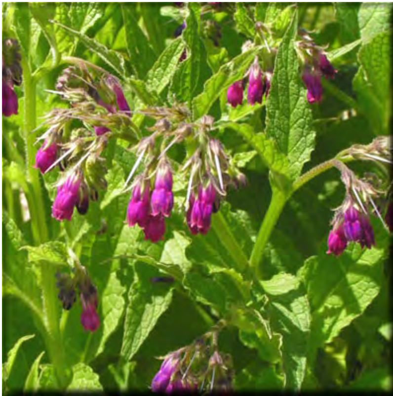
CONSUELDA MAYOR ( Symphytum officinale )

Cataplasmas de plantas frescas: Cola de caballo recién cogida se lava y se pica en el mortero hasta que se forme a modo de una papilla.